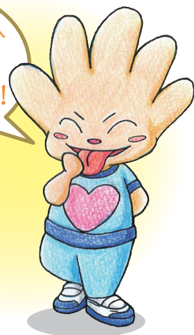
広島パークヒル病院公認キャラクター たっただ